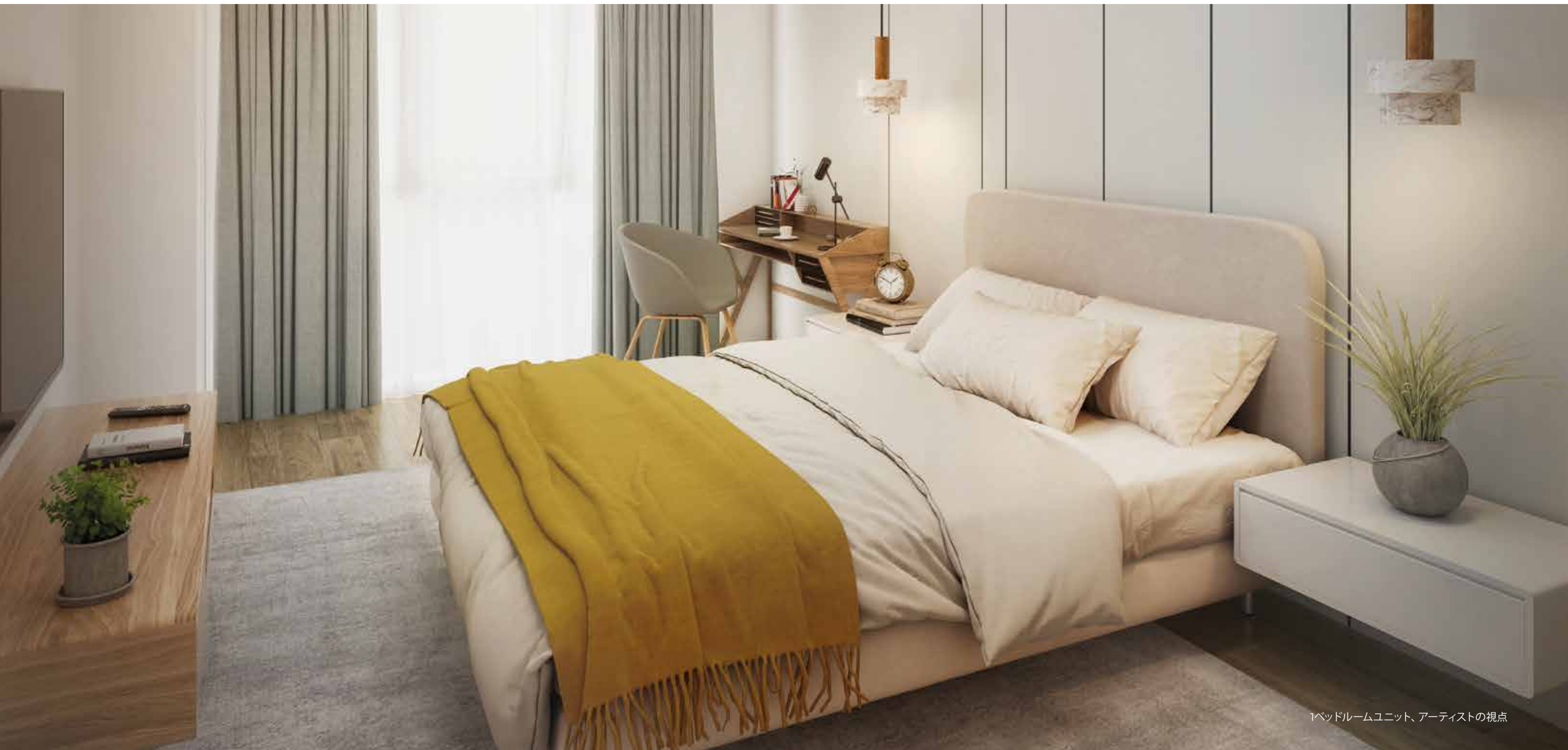
1ベッドルームユニット、アーティストの視点