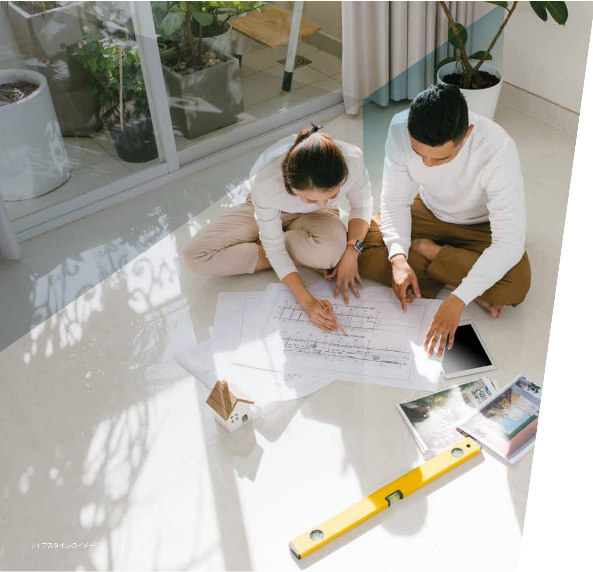
ライフスタイルのイメージ