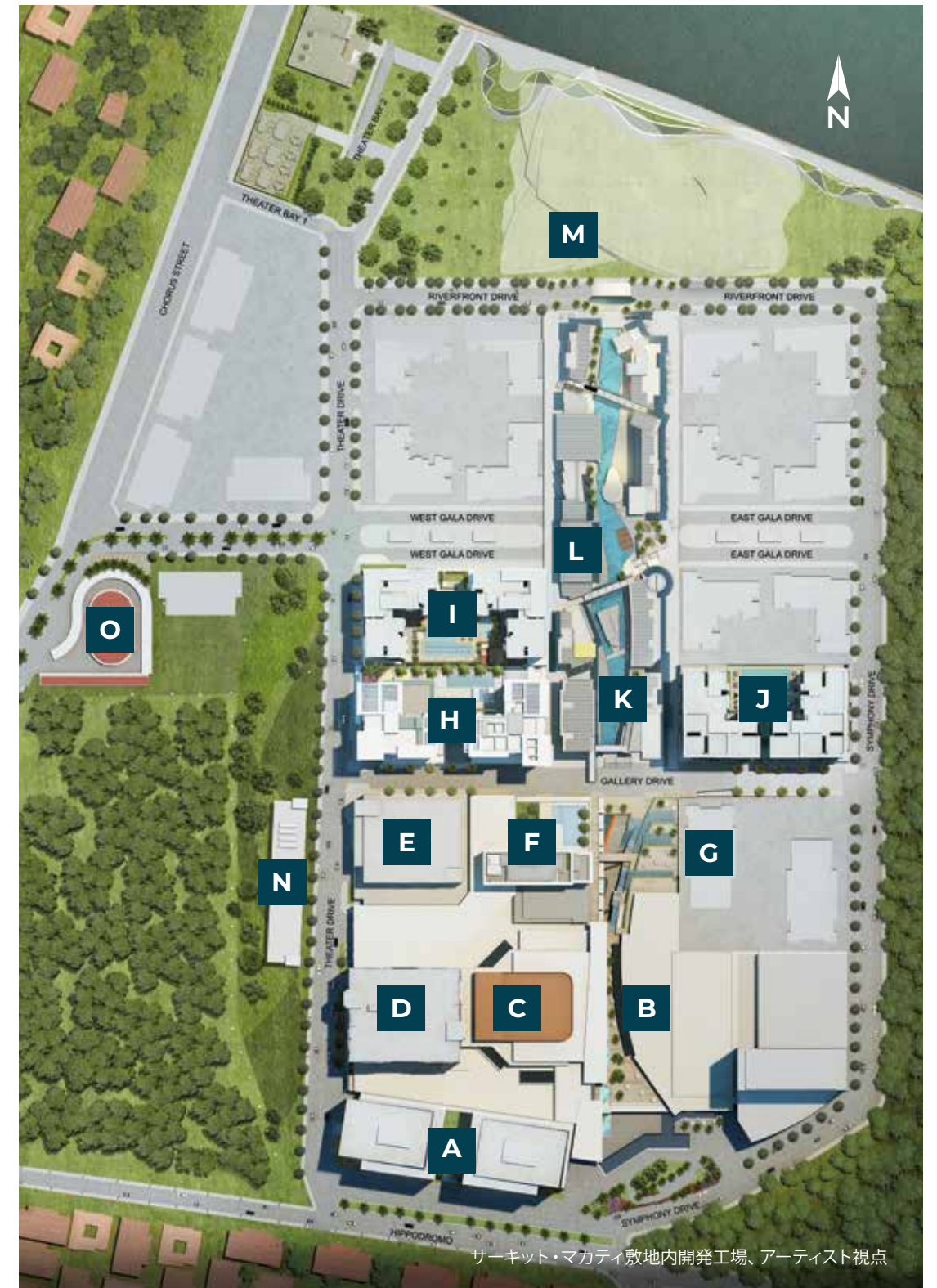
サーキット・マカティ敷地内開発工場、アーティスト視点

10,000平方メートルの売り場には、国内外のブランド、新しいコンセプトのレストラン、人気のレストやカフェが集まり、すべての人に多様な選択肢を提供しています。